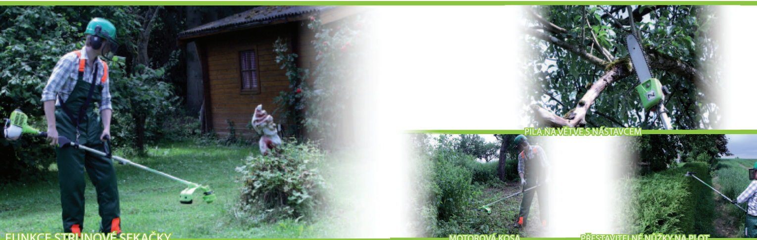
FUNKCE STRUNOVÉ SEKAČKY