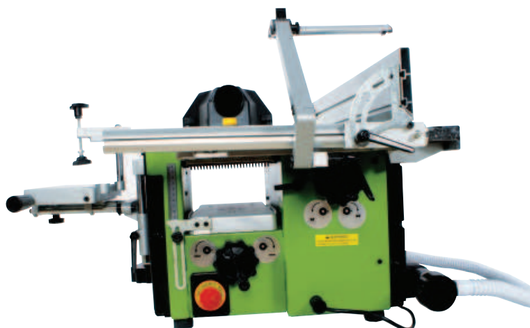
Velký výška protahu large thicknessing capacity