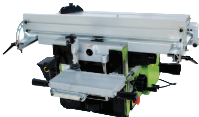
Včetně dlabacího agregátu mortising unit included