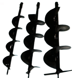
3 velikosti vrtáku